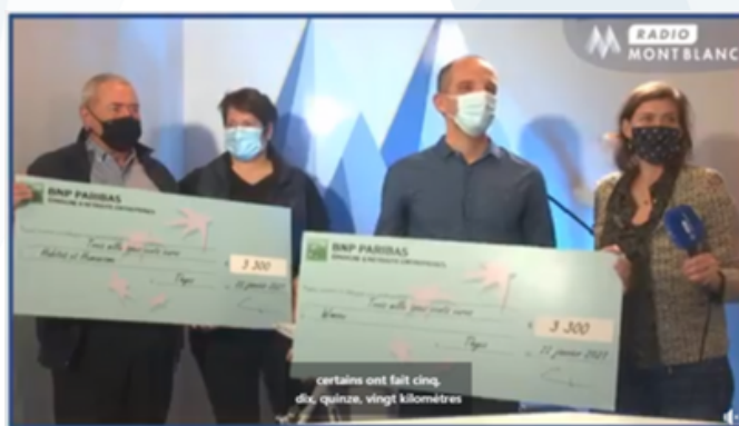
Tout du Mont-Blanc à vélo solidaire | Remise des chèques